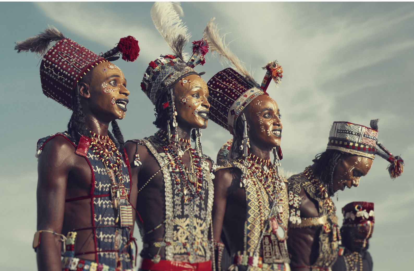
Wodaabe | Gerewol festival, Bossio, Chari-Baguirmi region | Chad, 2016

Pleines de mouvements, de lumière, de fumées et de couleurs, les festivités s'animent au rythme de la musique et les chants, tambours, costumes, danses envahissent les murs.