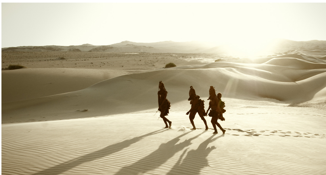
Himba / Hartmann Valley, Catena | Namibia, 2011

Dans les paysages, des communautés apparaissent lentement, traversant le décor. Des rires et chants d'enfants montent peu à peu.