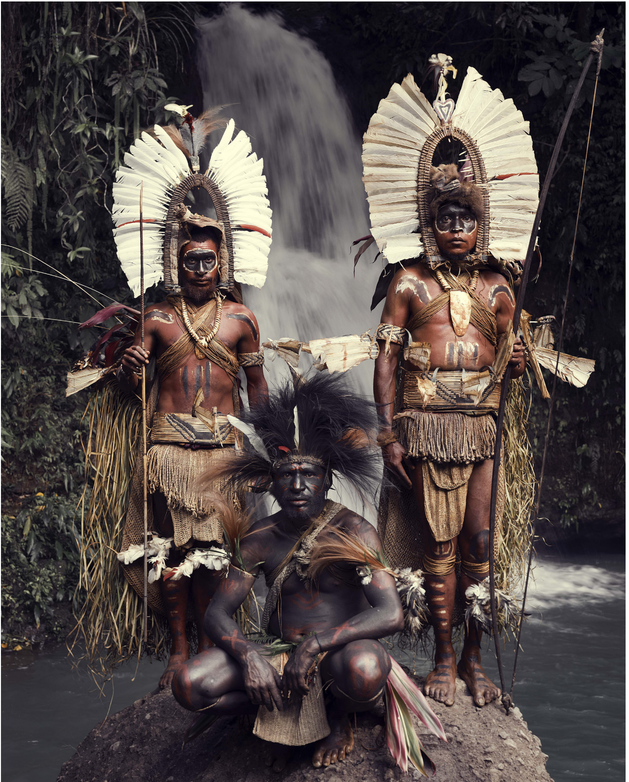
Kaluli | Mount Bosavi, Southern Highlands province, the Highlands | Papua New Guinea, 2017