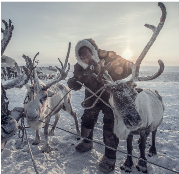
Dolgans / Anabar district, Yakutia | Siberia, 2018

Dans cette séquence, les photographies montrent une partie de la vie quotidienne de ces communautés et les nécessités de base (subsistance, langage, éducation) communes à tous les êtres humains. Les yeux du photographe se focalisent sur les enfants qui jouent, courent, rient : la joie envahit l'espace.