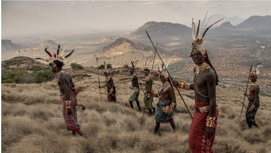
Samburu | Kenya, 2019

Le visiteur entre alors en contact avec ces hommes à la fois fiers et énigmatiques. Des rivières apparaissent, parcourant le paysage comme des veines. Ces veines aqueuses se transforment ensuite en branches d'arbres sur lesquelles prennent place des familles.