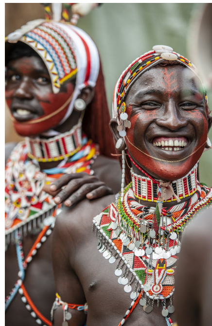
Samburu | Kenya, 2019