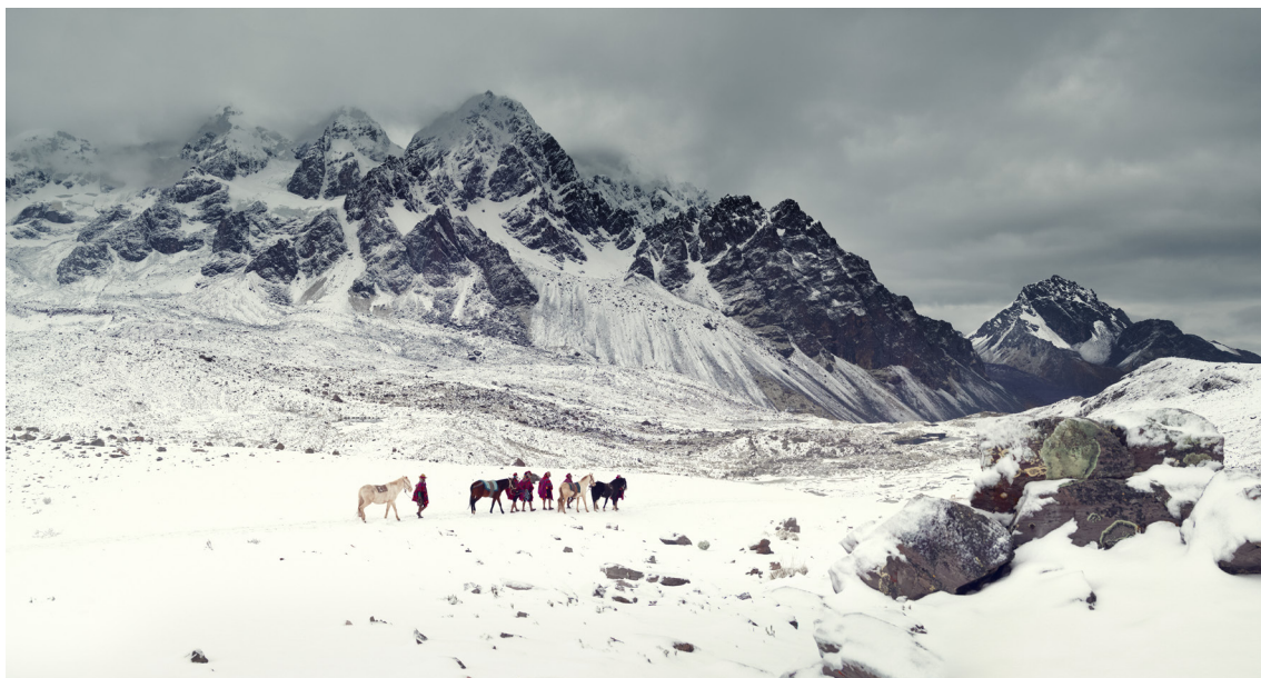
Qero / Ausangate Mountain Range, Andes | Peru, 2018

« Jimmy Nelson, Les Gardiens de l'Humanité - The Last Sentinels » commence dans l'obscurité, avec seulement les lumières abstraites des gratte-ciel visibles. Lentement, les lumières de la ville se transforment en étoiles scintillantes dans un ciel sombre. L'obscurité cède la place à une douce teinte rose qui s'élève avec l'aube : la nature s'éveille et les sons des oiseaux, des insectes et de la faune inondent l'espace. Un nouveau jour commence, comme une invitation au voyage.