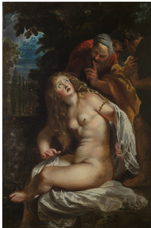
Pierre Paul Rubens, Suzanne et les vieillards, vers 1606-1607, huile sur toile, 94 x 67 cm, Galleria Borghese, Rome.