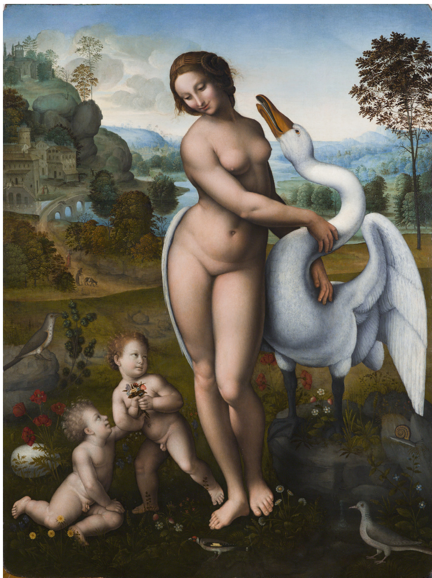
Léonard de Vinci (d'après), Léda, vers 1510-1520, tempera sur panneau, 115 x 86 cm, Galleria Borghese, Rome.

COMMUNIQUÉ DE PRESSE Réouverture Début septembre 2024