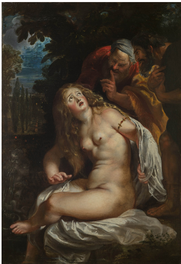
Pierre Paul Rubens, Suzanne et les vieillards , vers 1606-160, huile sur toile, 94 x 67 cm, Galleria Borghese, Rome.