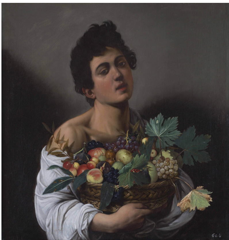
Caravage, Garçon à la corbeille de fruits, vers 1595, huile sur toile, 70 x 67 cm, Galleria Borghese, Rome.

Le Musée Jacquemart-André a le souci de mettre en avant des figures de collectionneurs qui ont marqué l'histoire de l'art, à l'image du couple formé par Édouard André et Nélie Jacquemart. Ceux-ci ont constitué une riche collection de peintures, de sculptures et de mobilier italiens du Moyen-Âge au XVIII e siècle, faisant du Musée Jacquemart-André l'une des institutions françaises de référence pour l'art de ce pays. Les chefs-d'œuvre réunis par les Borghèse seront ainsi particulièrement bien entourés au sein de ce musée italien au cœur de Paris.