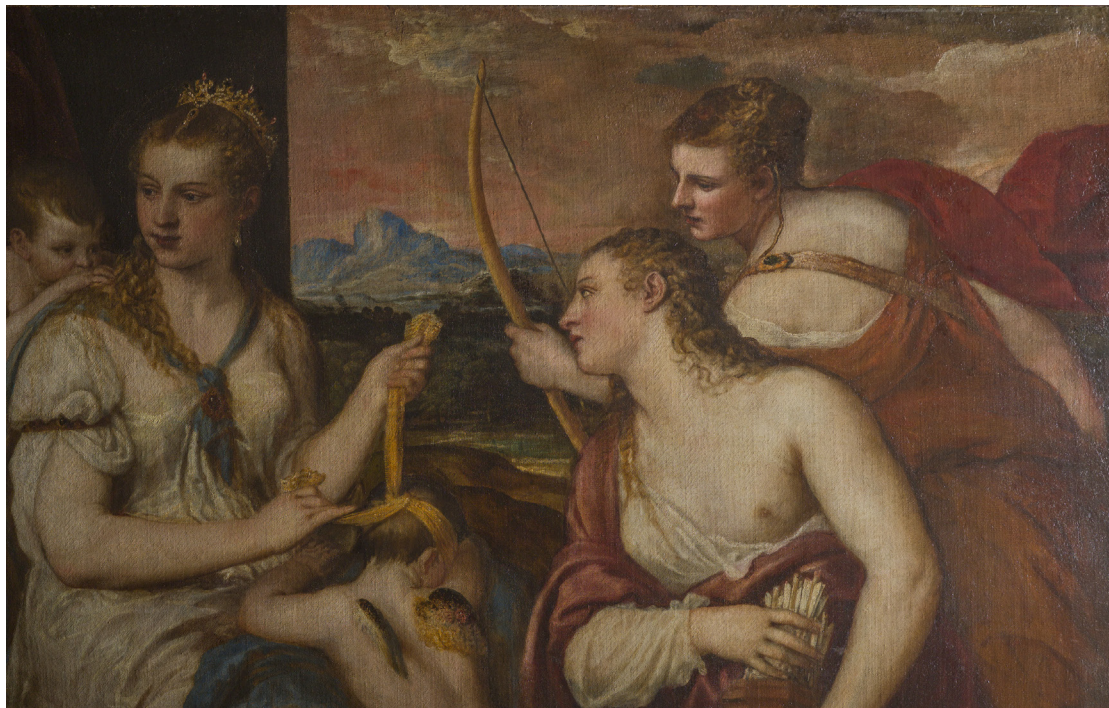
Titien, Vénus bandant les yeux de l'Amour , vers 1565, huile sur toile, 116 x 184 cm, Galleria Borghese, Rome.

COMMUNIQUÉ DE PRESSE Réouverture Début septembre 2024