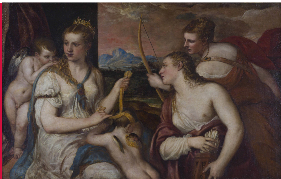
Titien, Vénus bandant les yeux de l'Amour , vers 1565, huile sur toile, 116 x 184 cm, Galleria Borghese, Rome.