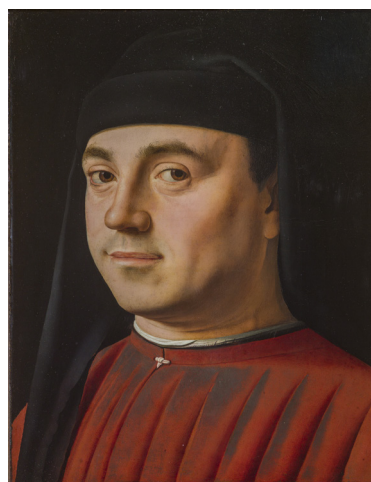
Antonello da Messina, Portrait d'homme , vers 1476, tempera et huile sur panneau, 31 x 25,2 cm, Galleria Borghese, Rome.