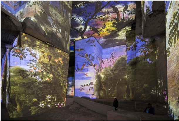
Bosch, Brueghel, Arcimboldo © Culturespaces / Eric Spiller