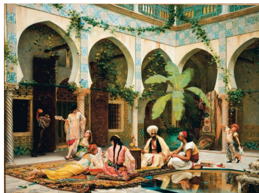
Gustave Boulanger, La Cour du Palais de Dar Khdaouedj El Amia, Alger , 1877, huile sur toile, 83,8 x 114,3 cm, collection privée