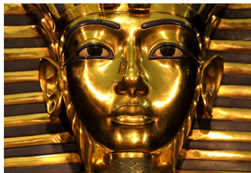
Masque funéraire de Toutânkhamon (1345-1327 av. J.-C.), 54cm x 39,3cm x 49cm, or, verre, lapis-lazuli, pierres semi-précieuses, 10,32 kg, Grand Musée égyptien, Le Caire