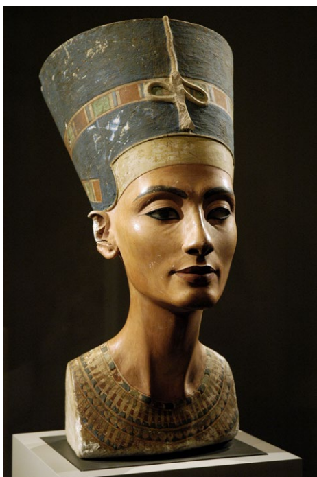
Buste de Néfertiti, vers 1351-1334 av. J.-C., pierre calcaire, stuc peint, Neues Museum, Berlin