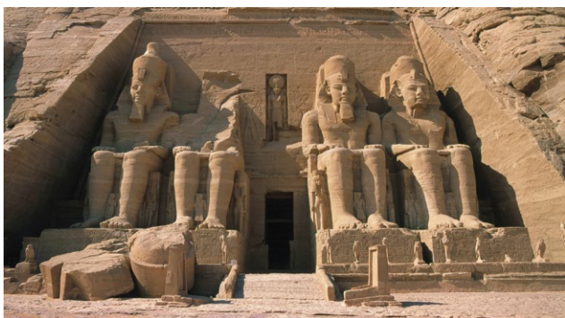
Statues colossales de Ramsès II, entrée du temple d'Abou Simbel, vers 1260 av. J.C., Abou Simbel