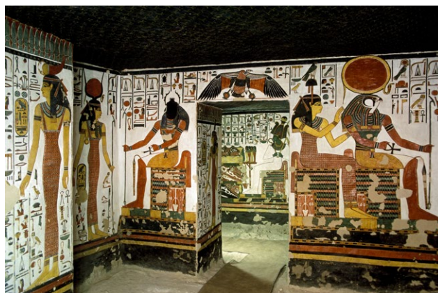
Vestibule de la tombe de Néfertari, première Grande Épouse Royale de Ramsès II, vers 1290-1255 av. J.C., Vallée des Reines, Louxor