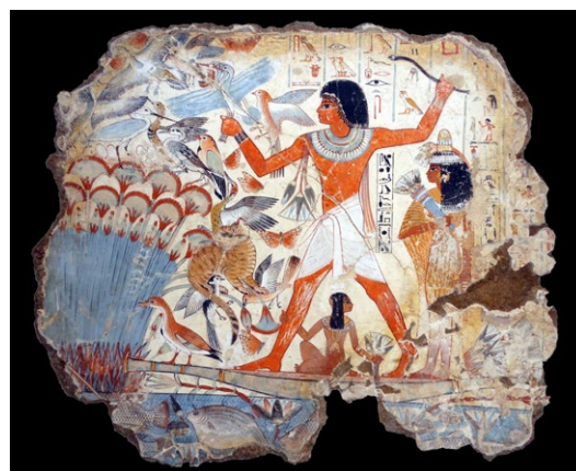
Scène de chasse, fragment de fresque provenant de la tombe de Nebamun, vers 1350 av. J.C., British Museum, Londres, © akg-images / WHA / World History Archive