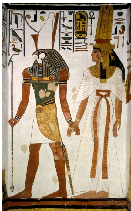
Reine Néfertari et Horus, détail, peinture murale de la tombe de Néfertari, vers 1290-1255 avant J.-C., Vallée des Reines, Louxor