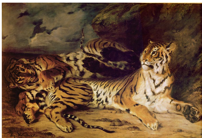
Eugène Delacroix, Jeune tigre jouant avec sa mère , 1830, huile sur toile, 130,5 x 195 cm, Musée du Louvre, Paris