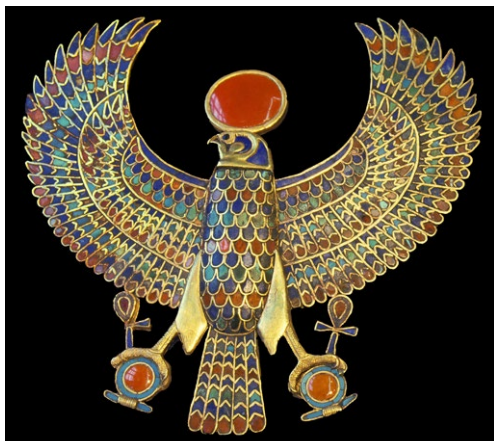
Bijou pectoral en forme de faucon, vers 1357-1336 av. J.-C., or, lapis-lazuli, turquoise, cornaline et verre, 12,6 x 11,7 cm, trésor de Toutânkhamon, Grand musée égyptien, Le Caire