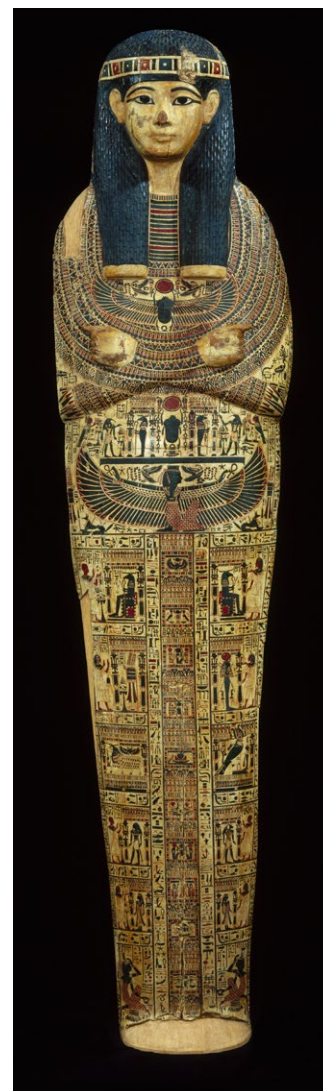
Couverture de la momie de Soutymes, prêtre supérieur de Karnak, vers 1069-943 avant J.-C., bois peint et stucage, 175 x 44 x 15,3 cm, Musée du Louvre, Paris