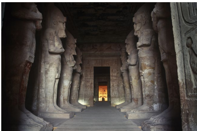
Salle hypostyle avec colosses osiriaques représentant Ramsès II, vers 1260 av. J.C., Abou Simbel