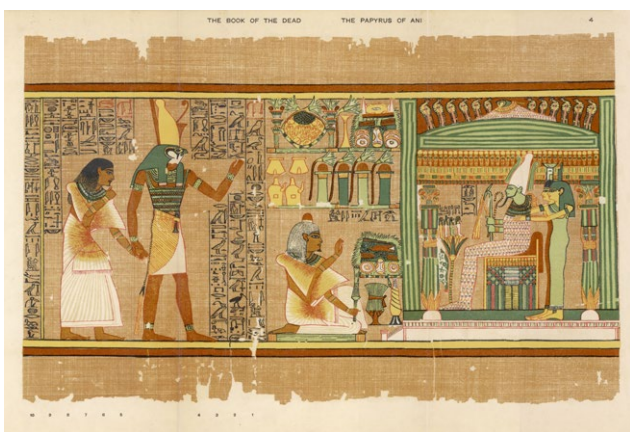
Le mort Ani est présenté à Osiris, reproduction du Papyrus d'Ani, vers 1250 avant J.-C., acquis en 1913 par E. A Wallis Budge, British Museum, Londres