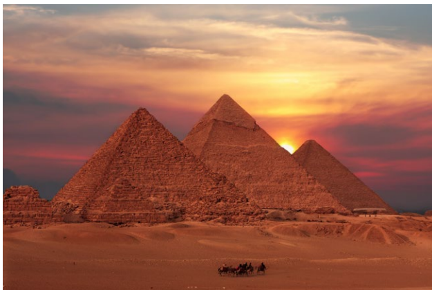
Pyramides de Khéops, Khéphren et Mykérinos, entre 2600 et 2500 avant J.-C., Gizeh