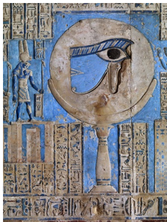
L'Œil d'Horus, détail du plafond astronomique, salle hypostyle du temple d'Hathor, 50-48 avant J.-C., Dendérah