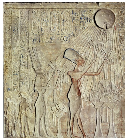
Stèle (détail) représentant Akhenaton avec Néfertiti et leurs filles portant des offrandes à Aton, pierre calcaire, provenant de Tell el-Amarna, Musée Egyptien, Le Caire