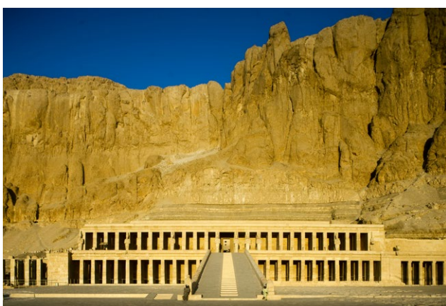
Temple funéraire d'Hatshepsout, vers 1472-1457, Deir el-Bahari