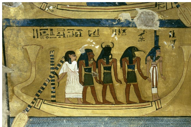
Barque sacrée, détail du Livre des Morts , peinture murale, tombe d'Inerkhau, vers 1186–1146 av. J.-C., Louxor