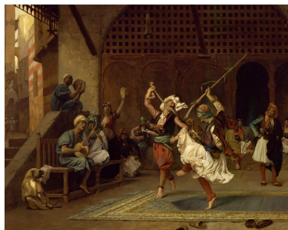
Jean-Léon Gérôme, La Danse Pyrrhique , 1885, huile sur bois, 71 x 80 cm, collection privée